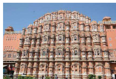
Le palais des vents