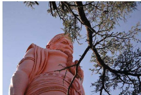
Shimla, Dieu Hanuman à tête de singe.

Dans les rues de Shimla, les singes sont partout y compris dans les hôtels