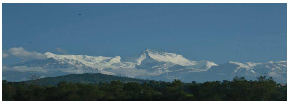
La chaîne des Annapurna depuis POKHARA.