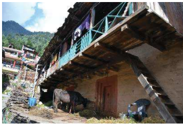
Ferme à Manali

Commerces de rue, on vit, on se soigne, on meurt dans la rue.